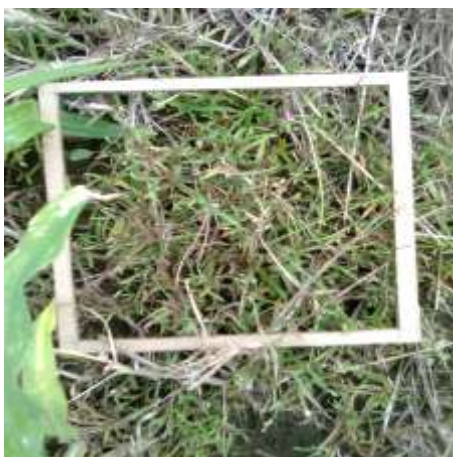
Control químico de piñita TRAT. 7