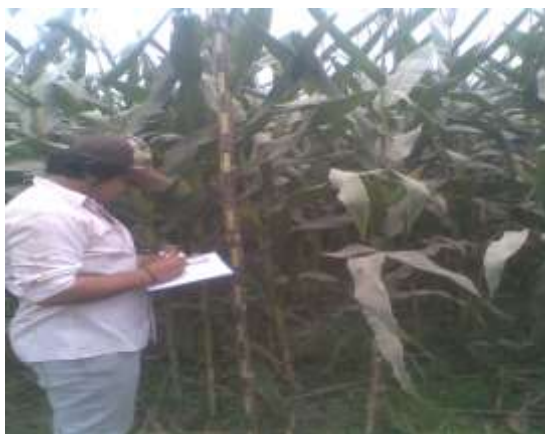
Muestreo de altura de planta en hileras de la parcela útil