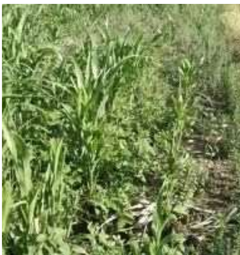
Mal desarrollo del cultivo de maíz debido a competencia con malezas TRAT. 3