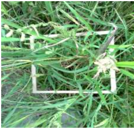
Control químico de piñita TRAT. 3