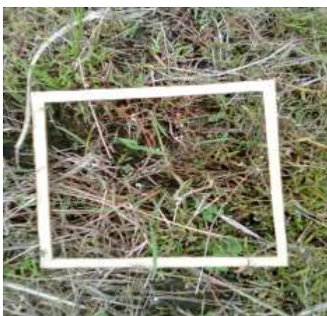
Control químico de piñita TRAT. 6