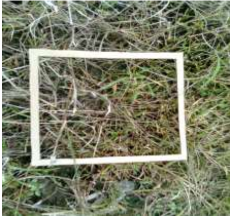
Control químico de piñita TRAT. 1