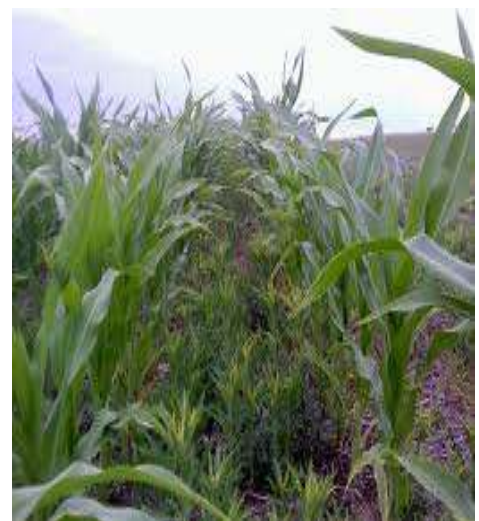
Mal desarrollo del cultivo de maíz debido a competencia con malezas TRAT. 6