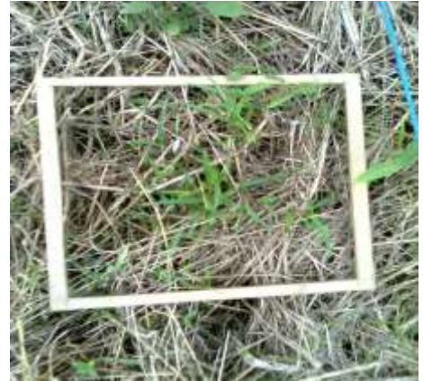
Control químico de piñita TRAT. 2