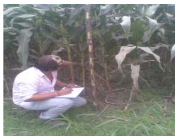
Muestreo de inserción de primera mazorca en hileras de la parcela útil