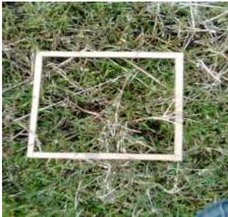
Control químico de piñita TRAT. 4