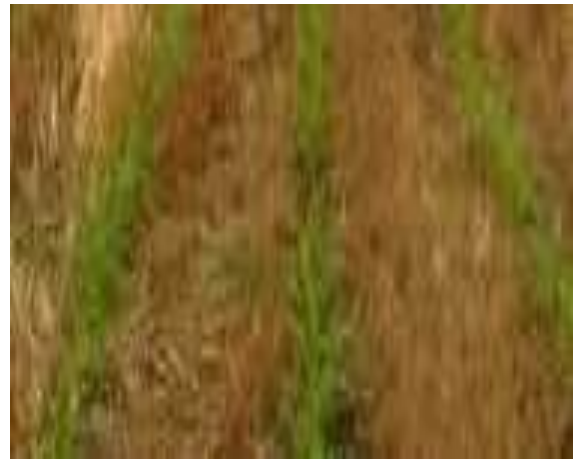
10 días después de la aplicación TRAT. 1