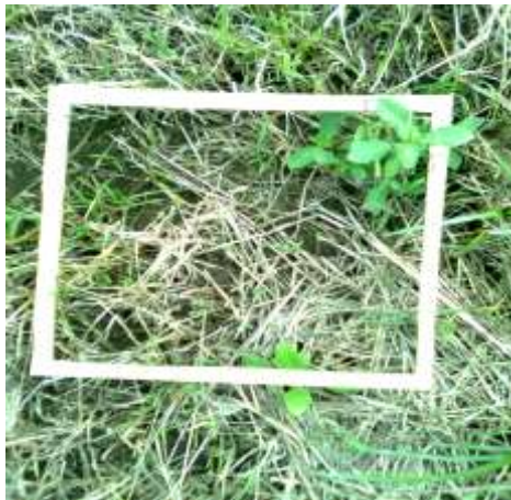
Control químico de piñita TRAT. 3 primer aplicación