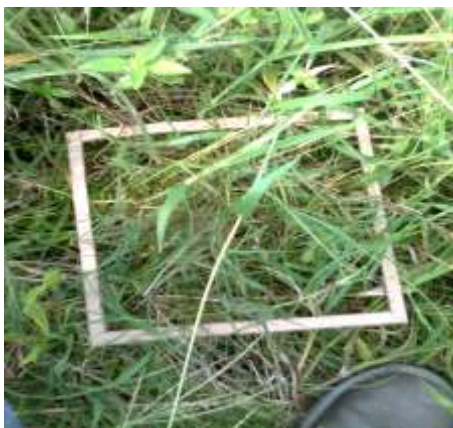
Control químico de piñita TRAT. 5