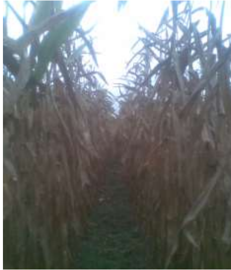
Secado fisiológico del cultivo de maíz