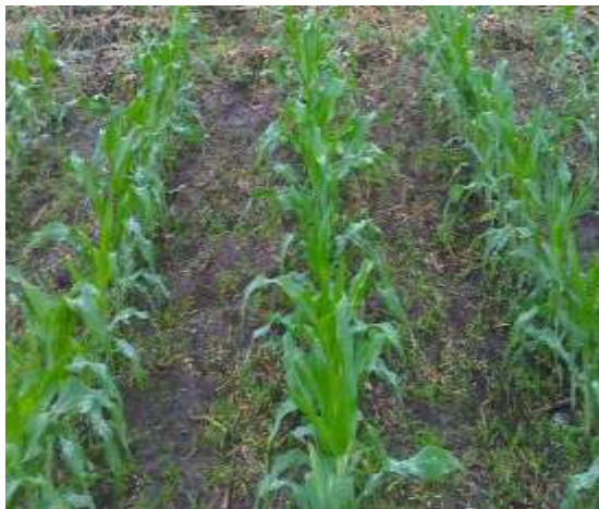
21 días después de la aplicación TRAT. 1