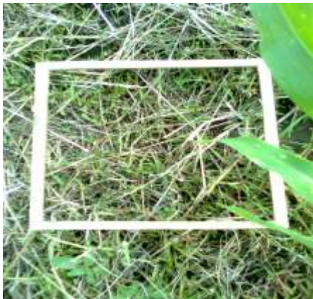
Control químico de piñita TRAT. 9