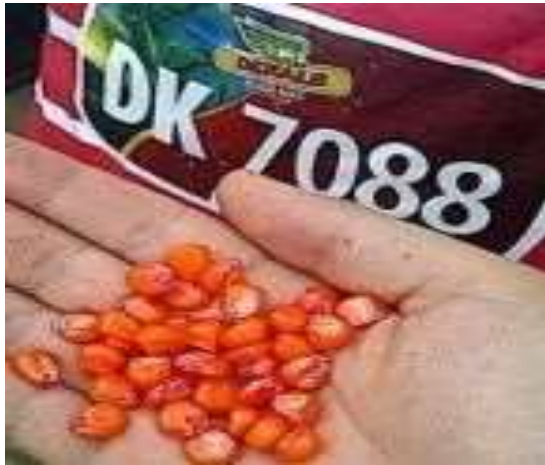
Material Genético DEKALB 7088